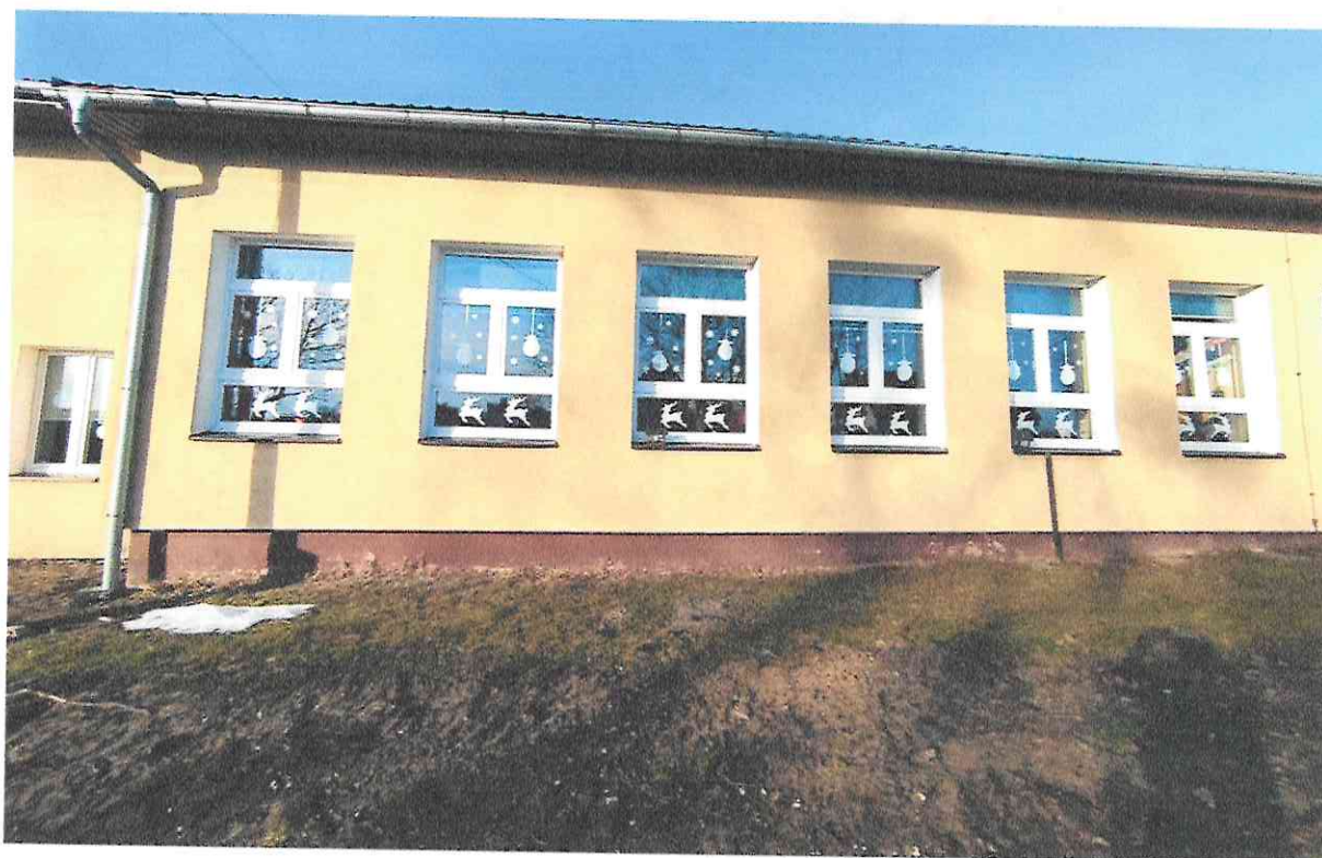
Fot. 5. Lisowice, ul. Mickiewicza 22 – budynek Szkoły Podstawowej. Segment B – część elewacji południowej (fot. z dn. 22.01.2025)