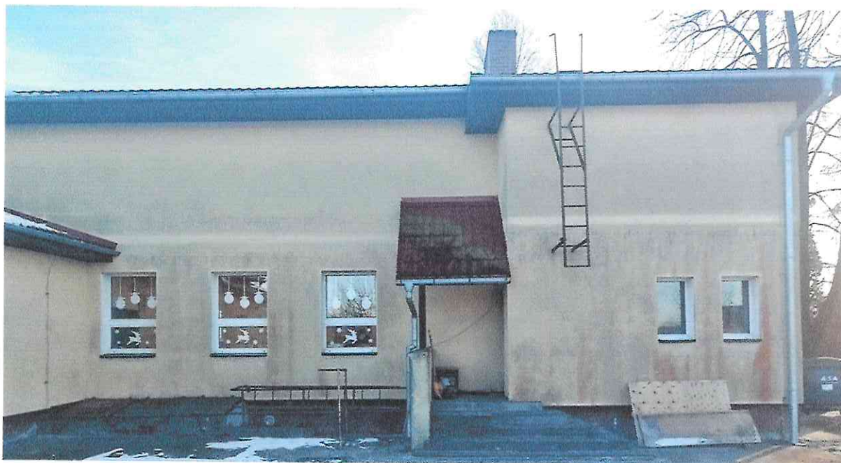
Fot. 18. Lisowice, ul. Mickiewicza 22 – budynek Szkoły Podstawowej. Segment A – część elewacji północnej (fot. z dn. 22.01.2025)