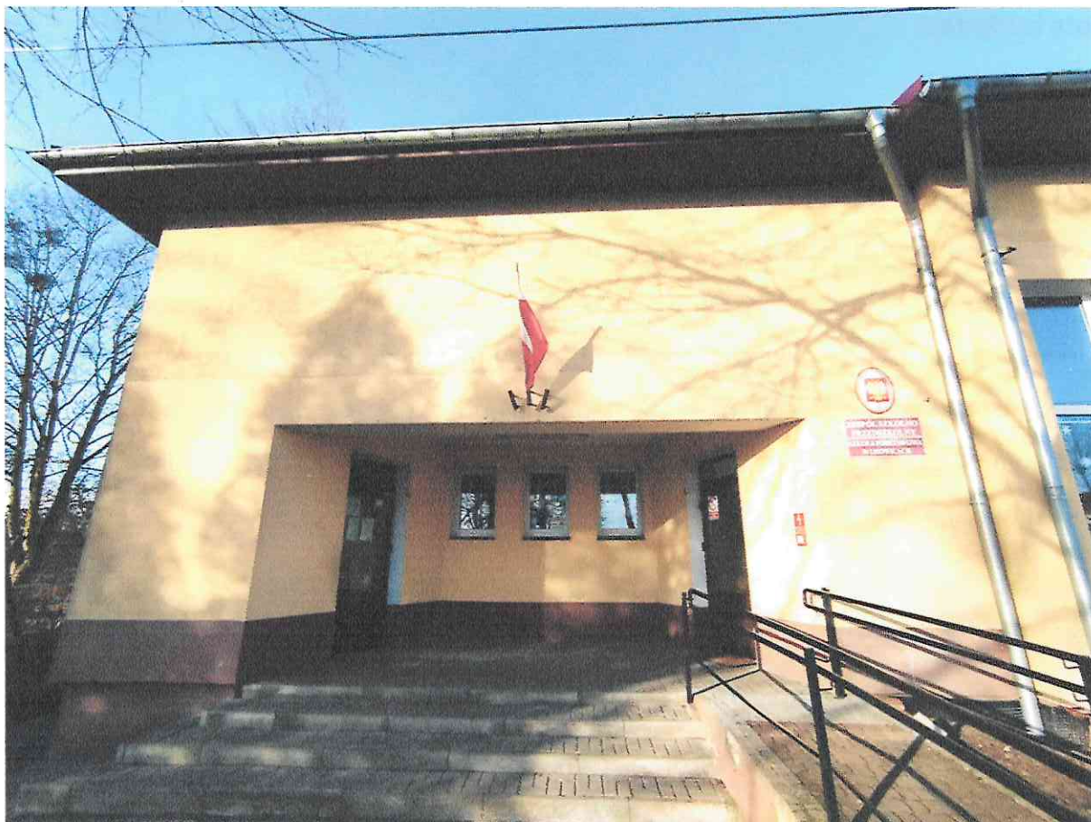
Fot. 2. Lisowice, ul. Mickiewicza 22 – budynek Szkoły Podstawowej. Wejście główne, segment A – część elewacji południowej (fot. z dn. 22.01.2025)