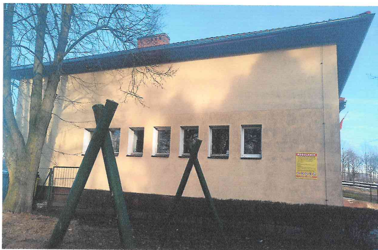
Fot. 19. Lisowice, ul. Mickiewicza 22 – budynek Szkoły Podstawowej. Segment A – elewacja zachodnia (fot. z dn. 22.01.2025)