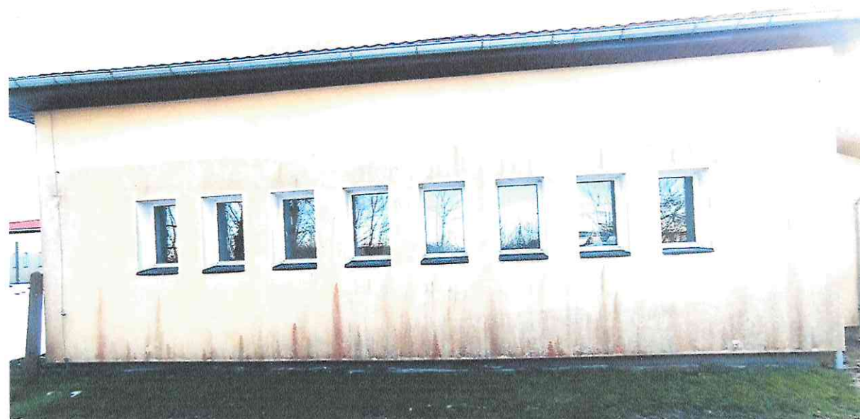
Fot. 15. Lisowice, ul. Mickiewicza 22 – budynek Szkoły Podstawowej. Segment C – elewacja północna (fot. z dn. 22.01.2025)