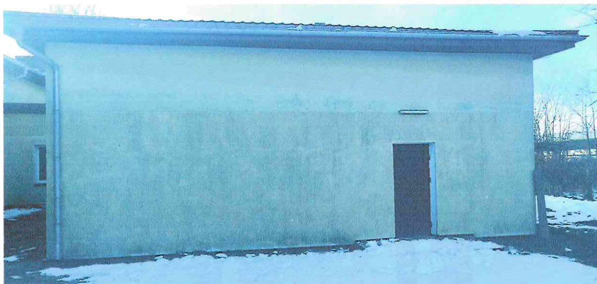
Fot. 14. Lisowice, ul. Mickiewicza 22 – budynek Szkoły Podstawowej. Segment C – elewacja wschodnia (fot. z dn. 22.01.2025)