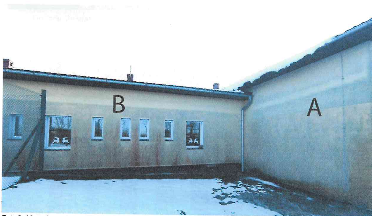
Fot. 9. Lisowice, ul. Mickiewicza 22 – budynek Szkoły Podstawowej. Segment B – część elewacji północnej oraz elewacja wschodnia segmentu A (fot. z dn. 22.01.2025)