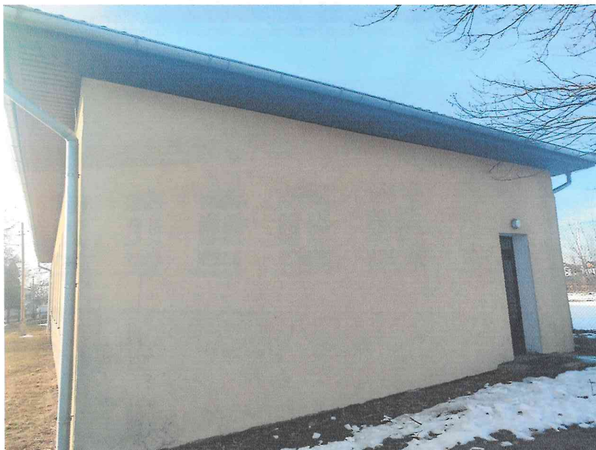
Fot. 7. Lisowice, ul. Mickiewicza 22 – budynek Szkoły Podstawowej. Segment B – elewacja wschodnia (fot. z dn. 22.01.2025)