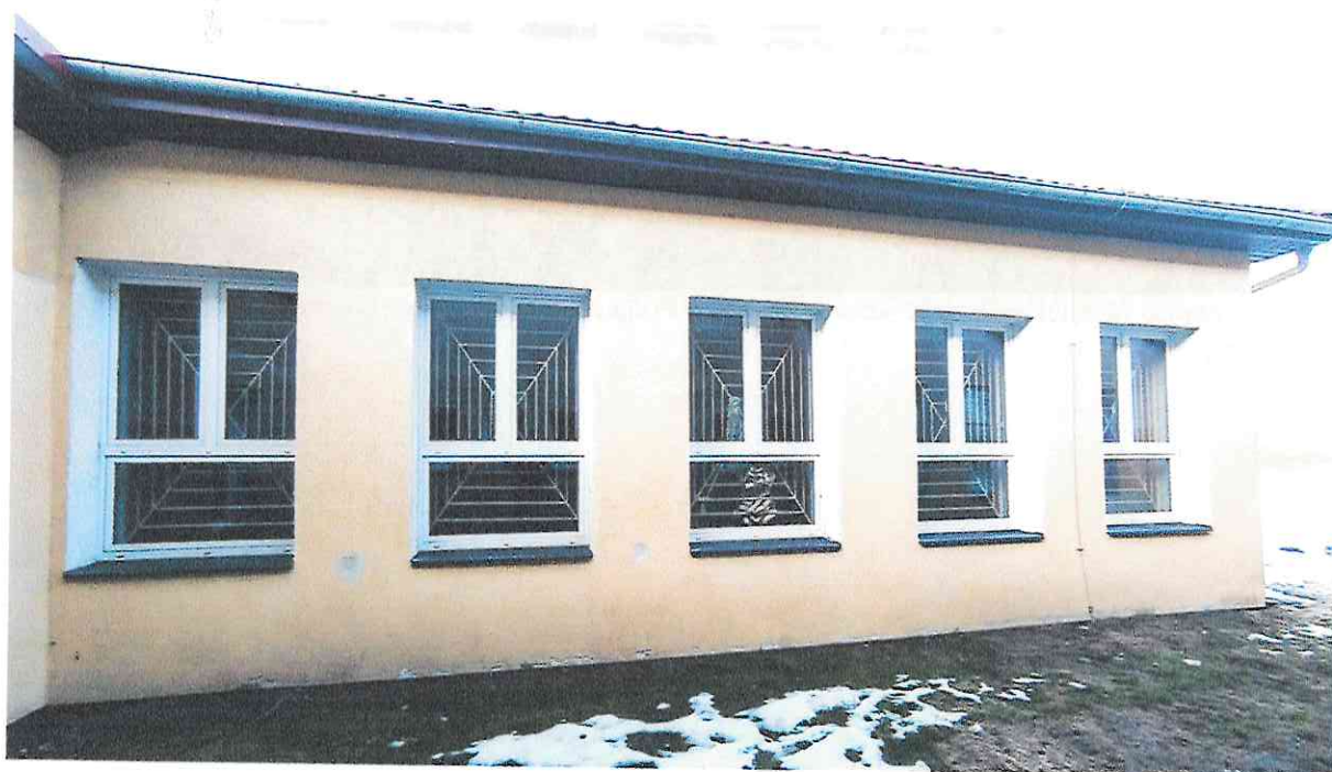
Fot. 13. Lisowice, ul. Mickiewicza 22 – budynek Szkoły Podstawowej. Segment C – elewacja południowa (fot. z dn. 22.01.2025)