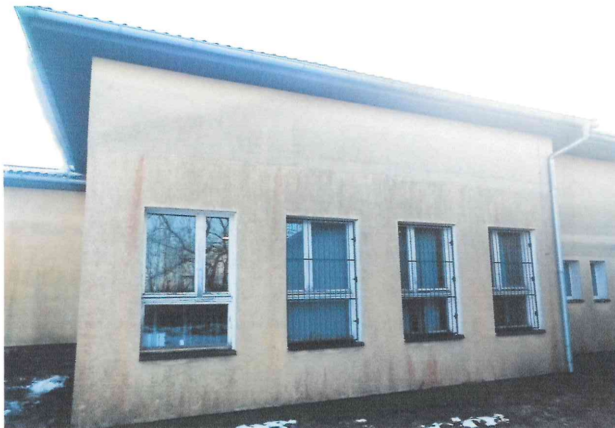
Fot. 10. Lisowice, ul. Mickiewicza 22 – budynek Szkoły Podstawowej. Segment A – część elewacji północnej (fot. z dn. 22.01.2025)