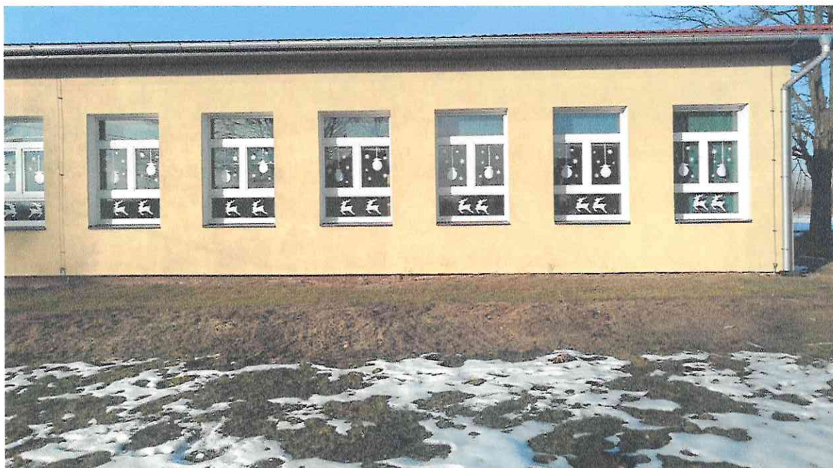
Fot. 6. Lisowice, ul. Mickiewicza 22 – budynek Szkoły Podstawowej. Segment B – dalszy ciąg elewacji południowej (fot. z dn. 22.01.2025)