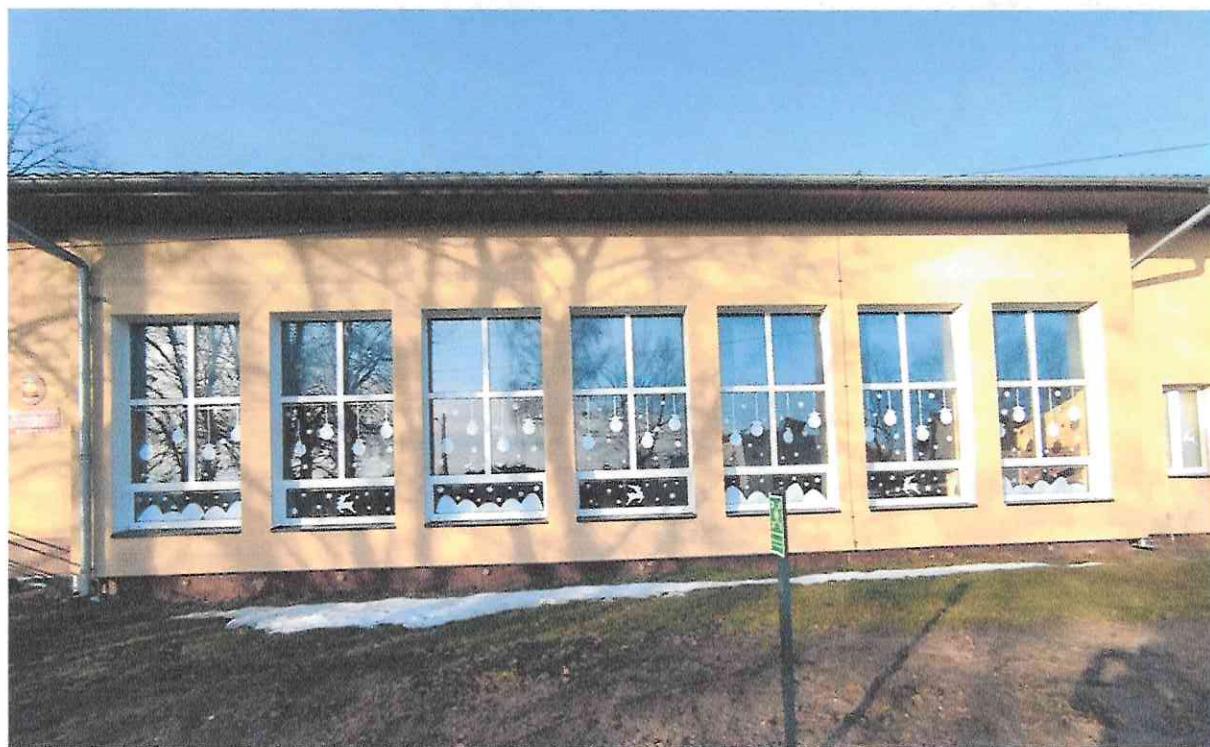
Fot. 3. Lisowice, ul. Mickiewicza 22 – budynek Szkoły Podstawowej. Segment A – dalsza część elewacji południowej (fot. z dn. 22.01.2025)