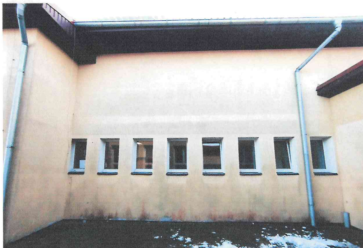
Fot. 11. Lisowice, ul. Mickiewicza 22 – budynek Szkoły Podstawowej. Segment A – dalszy ciąg elewacji północnej (fot. z dn. 22.01.2025)