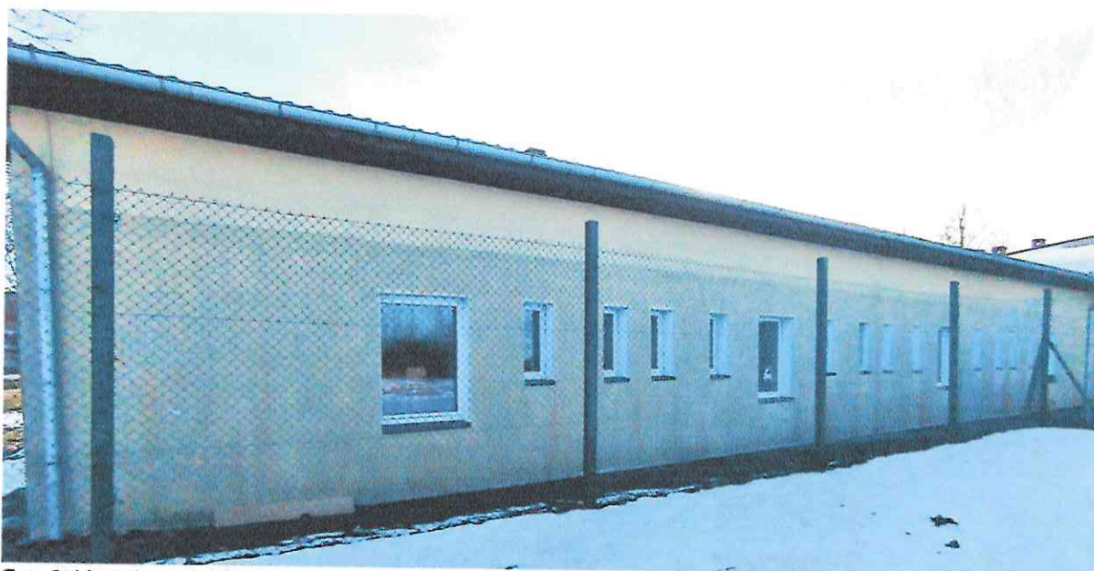
Fot. 8. Lisowice, ul. Mickiewicza 22 – budynek Szkoły Podstawowej. Segment B – elewacja północna