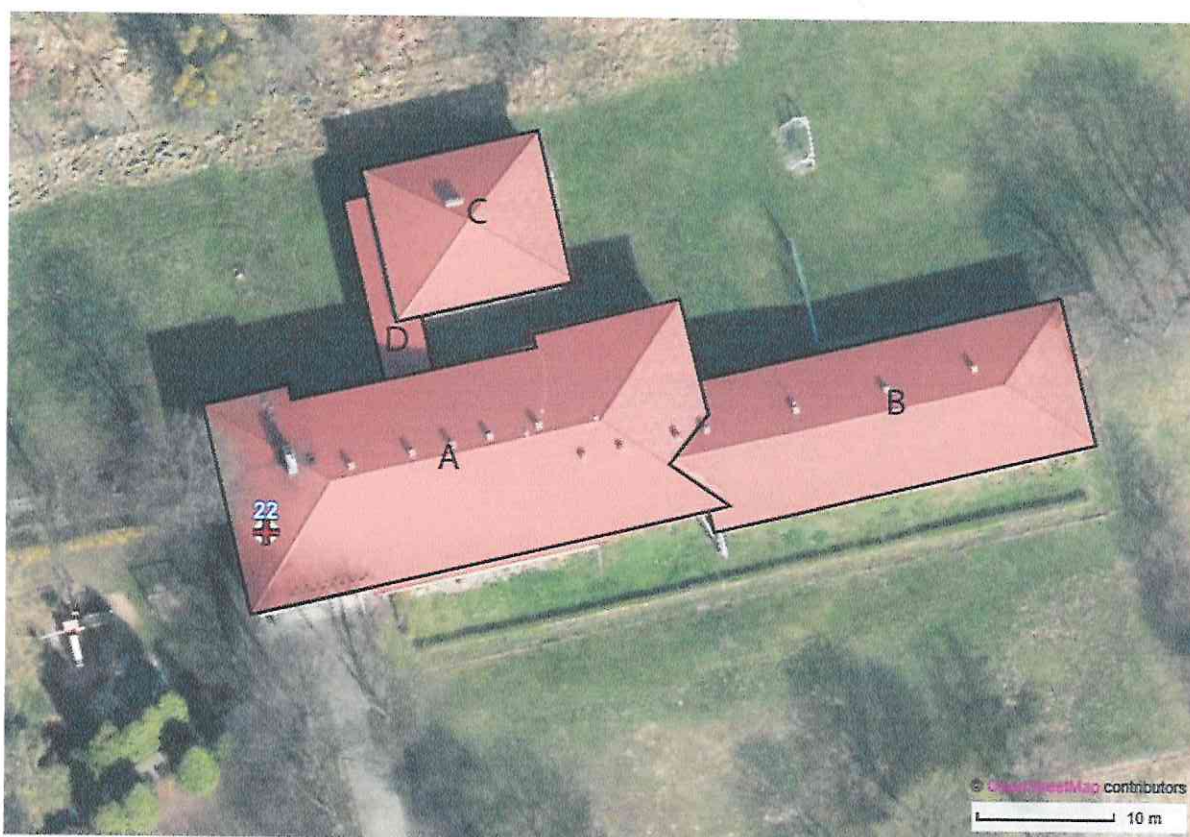
Fot. 1. Lisowice, ul. Mickiewicza 22 – budynek Szkoły Podstawowej – widok z góry. Wprowadzono umowny podział na segmenty na potrzeby przedmiotowego opracowania

Budynek będący przedmiotem opracowania jest obiektem wolnostojącym, podpiwniczonym częściowo pod kotłownię i skład opału, jednokondygnacyjnym, bez poddasza. Budynek składa się z kilku segmentów (fot. 1.) które poprzez system korytarzy tworzą jedną całość. Segmenty budynku pierwotnie posiadały stropodachy jednospadowe, pokryte kilkoma warstwami papy na lepiku. Podczas przeprowadzonej wcześniej termomodernizacji zmieniono dachy na budynku szkoły na wielospadowe kryte blachą a na budynku sali gimnastycznej na dach kopertowy kryty blachą (segment C). Przed laty ccieplono ściany zewnętrzne styropianem 12 cm.