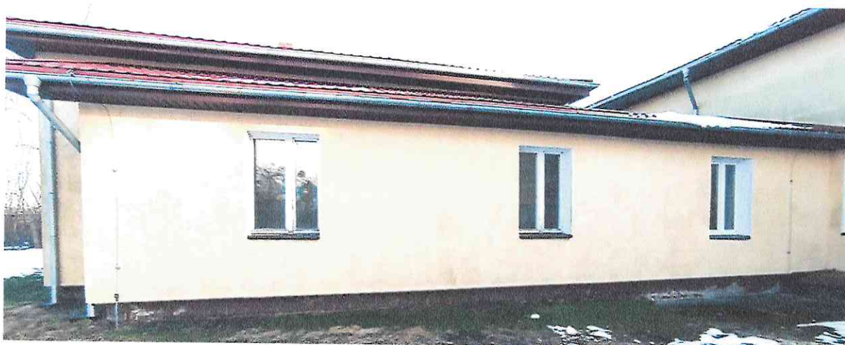
Fot. 17. Lisowice, ul. Mickiewicza 22 – budynek Szkoły Podstawowej. Segment C i D – elewacje zachodnie (fot. z dn. 22.01.2025)