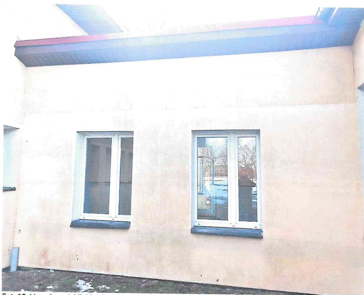
Fot. 12. Lisowice, ul. Mickiewicza 22 – budynek Szkoły Podstawowej. Segment D – elewacja wschodnia (fot. z dn. 22.01.2025)