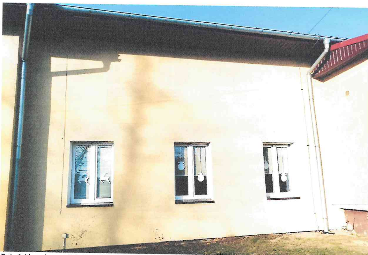
Fot. 4. Lisowice, ul. Mickiewicza 22 – budynek Szkoły Podstawowej. Segment A – końcowy fragment elewacji południowej (fot. z dn. 22.01.2025)